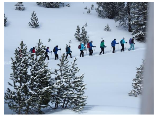
Schneeschuhtouren in der Schweiz

Kontaktieren sie mich gerne für weitere Informationen oder um an einer geplanten Reise oder Wanderung teilzunehmen. Ich freue mich, Sie auf unseren Abenteuern zu begrüßen.