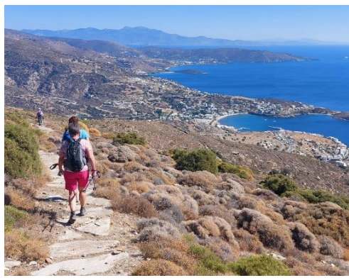
Wandern in Griechenland