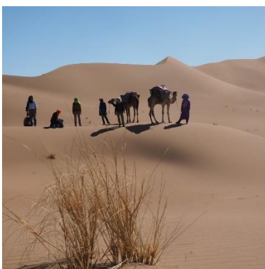
Unterwegs in der Sahara